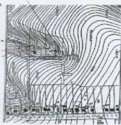
Схема розміщення проєктованого заораку № 1500